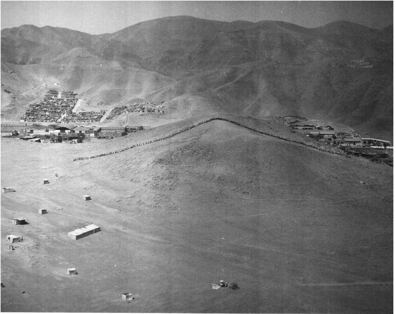
FRANCIS ALÿS, CUANDO LA FE MUEVE MONTAÑAS (WHEN FAITH MOVES MOUNTAINS), 11 AVRIL 2002_APRIL 11, 2002, LIMA, PÉROU_PERU