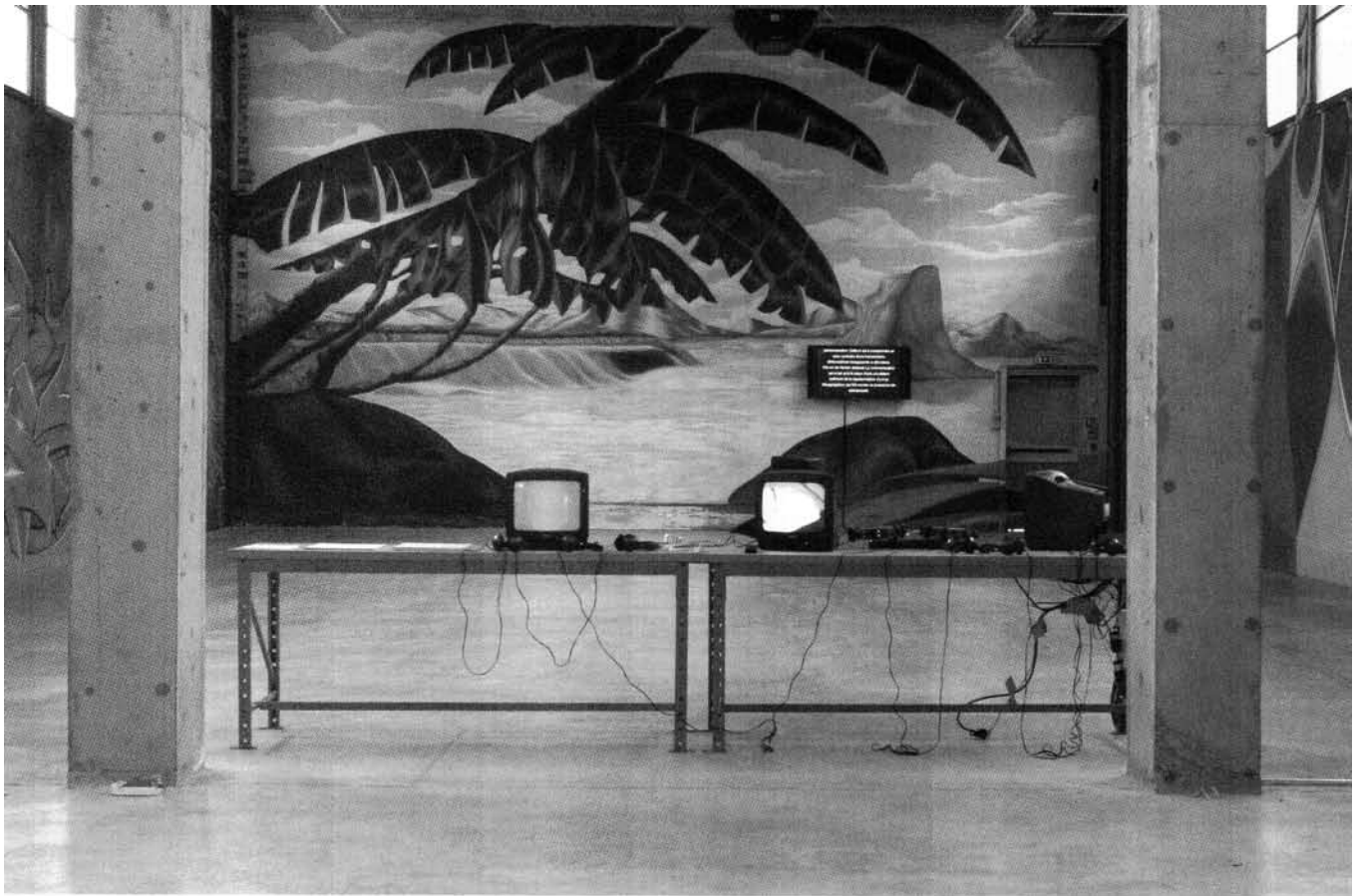
PIERRE JOSEPH, «ACTION RESTREINTE» (VUE DE L'EXPOSITION_EXIBITION VIEW), 2003, PALAIS DE TOKYO, PARIS; PHOTO REPRODUITE AVEC L'AIMABLE PERMISSION DE_COURTESY AIR DE PARIS, PARIS.

There is an interest in reception rather than in emission, a desire to see in what sense reception can become a form of artistic creation.