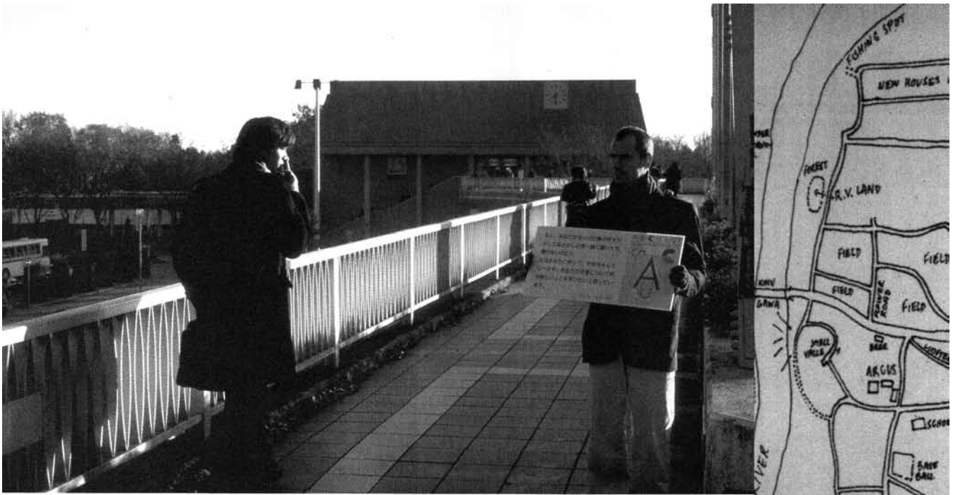
PIERRE JOSEPH, EARLY WORKS (PARTIE D'UN DIPTYQUE_PART OF A DIPTYCH), 1997, PHOTOGRAPHIE COULEUR SUR ALUMINUM_C-PRINT ON ALUMINUM, 30 x 20 cm; MAP OF JAPAN (DÉTAIL_DETAIL), 1997; PHOTOS REPRODUITES AVEC L'AIMABLE PERMISSION DE COURTESY AIR DE PARIS, PARIS. COLLECTION FRAC POITOU-CHARENTES.

normatives et productivistes des sociétés contemporaines; de se garder des marges de manœuvre qui épargnent toute soumission à la religion du projet, du rendement, du bénéfice et de l'efficacité. Le dilettantisme, force fluctuante, mineure, temporaire et non programmée, basée sur le désir et non pas sur la réaction, dont le principal atout est de refuser de se mesurer à d'autres forces... Forme d'action qui n'a besoin d'affronter personne pour s'affirmer. Et qui, pour autant, ne se présente pas comme un repli ou un exil. Quelques (rares) artistes choisissent ainsi l'amateurisme, la non-spécialisation, la non-maîtrise et parfois l'errance, pour appréhender le monde et élaborer des œuvres qui ont peu de goût pour la planification, la bataille ou la vocifération.