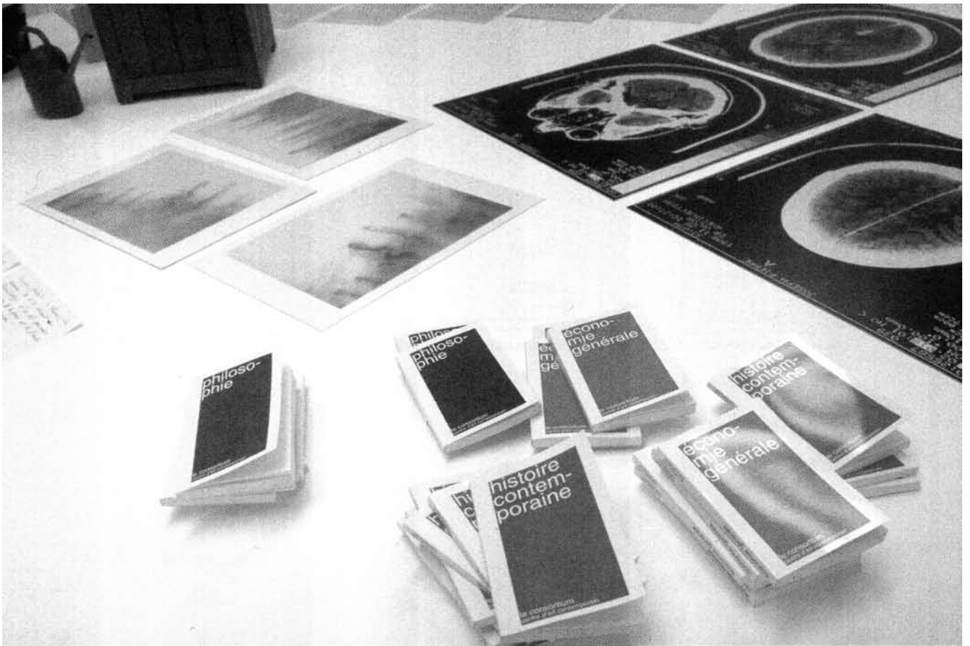
PIERRE JOSEPH, VUE DE L'EXPOSITION AU CONSORTIUM. EXHIBITION VIEW AT CONSORTIUM, DIJON (DÉTAIL DES NOTES EN FORME DE LIVRES. DETAIL OF NOTES IN BOOK FORMAT), 1999; PHOTO REPRODUITE AVEC L'AIMABLE PERMISSION DE...COURTESY AIR DE PARIS, PARIS.

travail. « Il s'agissait d'apprendre quelque chose de nouveau ce jour-là. Au hasard. » Ou bien encore un plan ( Map of Japan , 1998) réalisé de mémoire, après son retour, et retraçant uniquement ce dont il se souvient de ses trajets à pied et à vélo à travers Moriya City. On trouve peu de convictions, peu de certitudes, peu de maîtrise dans le travail de Pierre Joseph. Un intérêt pour la réception plutôt que pour l'émission; un souci de voir en quoi la réception peut devenir une forme de création. Toute une partie de son travail se présente sous la forme de témoignages de sa curiosité, de ses tentatives d'adaptation, de ses découvertes de cultures, de pratiques ou de techniques très diverses. (À travers des dispositifs d'installation très simples: voir l'exposition qu'il a réalisée au Consortium à Dijon, en 1999, pour laquelle, malgré les 500 mètres carrés disponibles, il